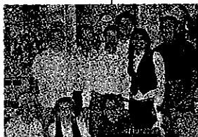
Lo staff della Trattoria Rosa Peonia